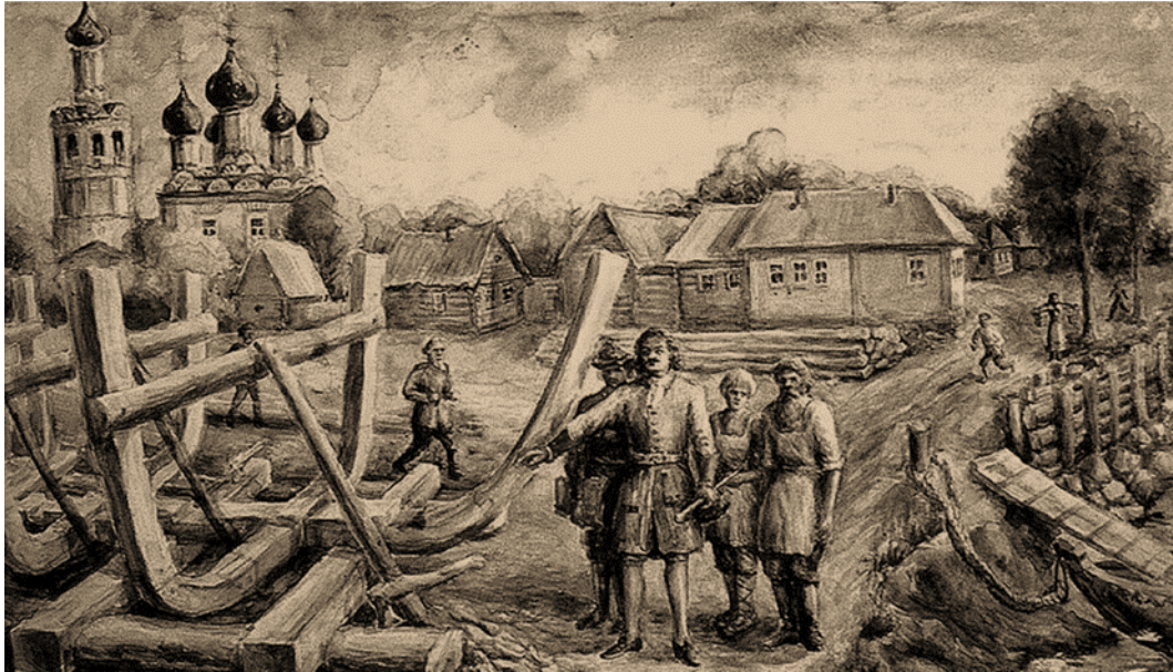
Петр I на Воронежской верфи

Царь торопился с постройкой галер, на что Лефорт отписывал ему в Воронеж: «А на пилавной мельнице работают денно и ночно, и доски готовят и пришлём к вашей милости» . Однако из-за спешки пришлось использовать для постройки галер сырой лес; из такого же леса готовили на местной лесопильной мельнице доски для обшивки галер. Также в Преображенском делали канаты, которые позже тоже увозили на воронежскую верфь.