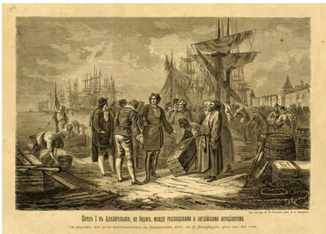
Альбом 200-летний юбилей Петра Великого 1672 - 1872 года