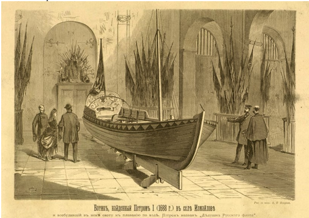
Ботик, найденный Петромъ I (1688 г.) въ селе Измайловъ и возбуждавший въ немъ охоту къ плаванію по водѣ. Петромъ названъ „Дюшка Русскаго флота“ Альбом 200-лѣтній юбилей Петра Великаго 1672 - 1872 года