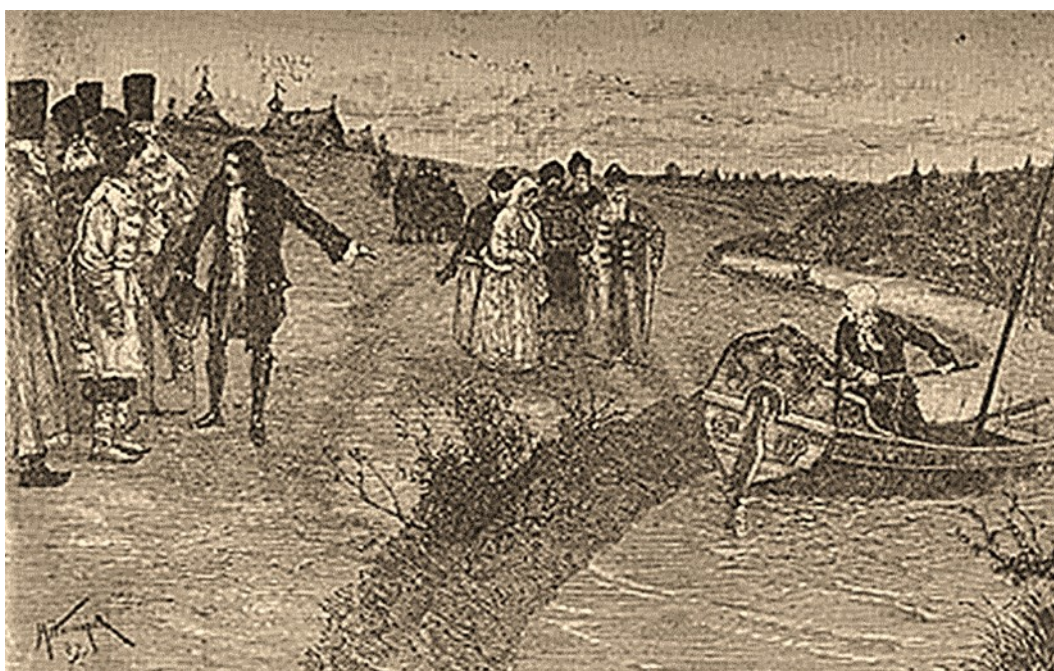
Спуск ботика на Яузе в Преображенском Гравюра по рисунку М.В. Нестерова. Из книги: Сеницын П.В. Преображенское

Ботик был перевезён в село Преображенское, где Брандт починил судно, оснастил его мачтой и парусами и стал первым наставником Петра в морском деле.