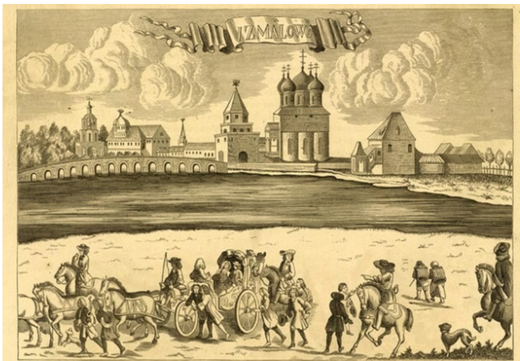
Село Измайлово Альбом 200-летний юбилей Петра Великого 1672 - 1872 года