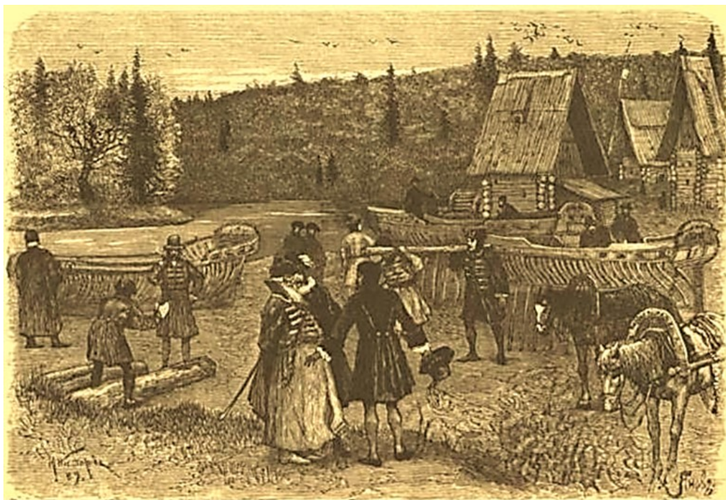
Строительство судов в в селе Преображенском. Гравюра по рисунку М.В. Нестерова. Из книги: Сеницын П.В. Преображенское

На верфях Воронежа и в Преображенском было развёрнуто масштабное строительство судов.