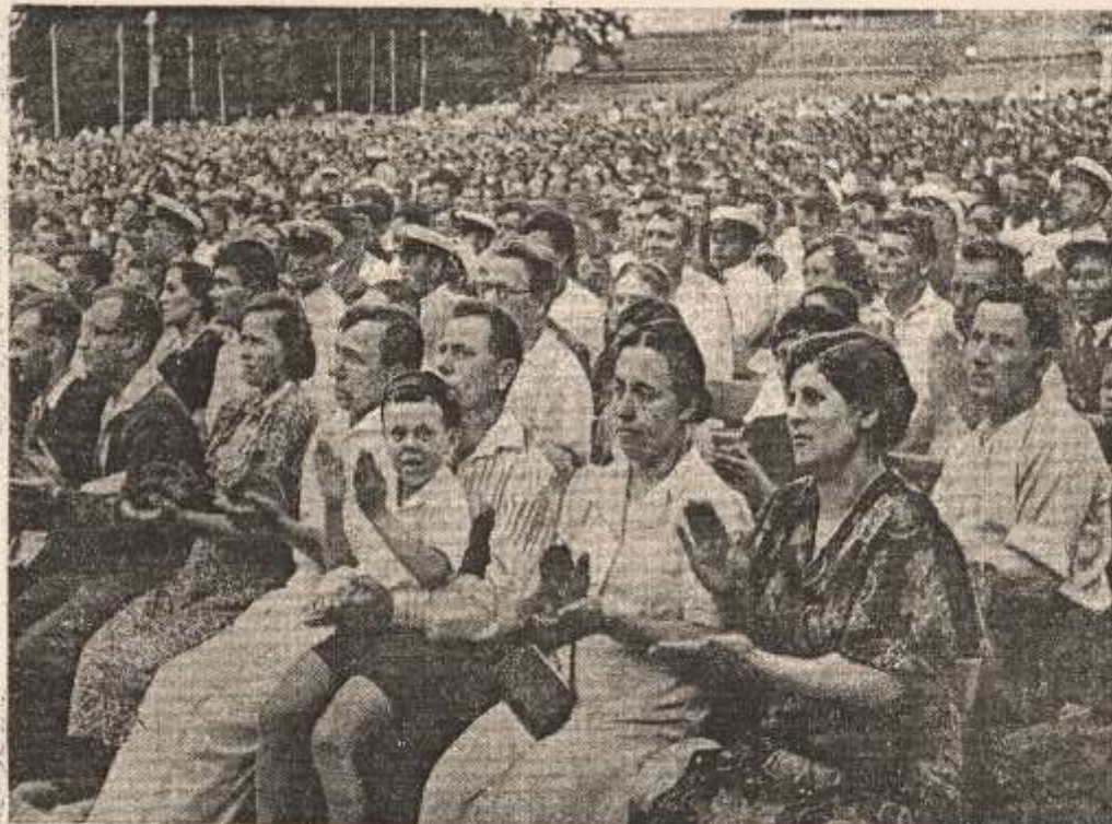
На торжественном заседании, посвященном Дню Военно-Морского Флота СССР, в Зеленом театре Центрального парка культуры и отдыха им. Горького (Москва). На трибуне — нарком Военно-Морского Флота, флагман флота 2-го ранга тов. Н. Г. Кузнецов.