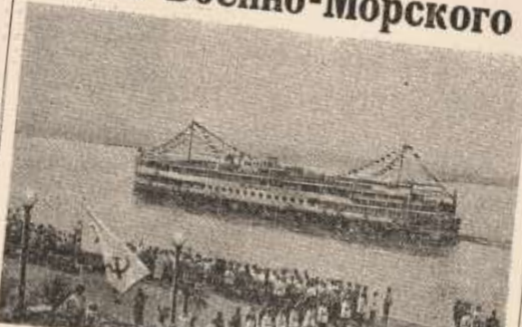
Водно-спортивный праздник на Хемингсово водохранилище. Покоривший Сталинский пролив наш трибунал.

Возле кораблей много тысяч человек. Среди подводных лодок могут гордиться техникой, но в превосходном командирском и инженерном кадрами партизанского движения. Через полчаса парадный зал. Он горнует радость, и вскоре можно разглядеть на воду вершины орудий торпедных катеров, за ними другие, третьи.