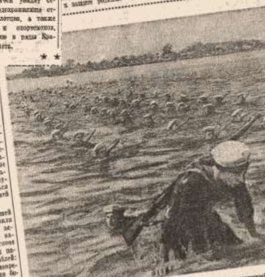
На празднике Военно-Морского Флота в Химках. Военно-морской флот.

Наша главная задача — восстановить и укрепить наши промышленные предприятия. Мы должны восстановить и укрепить наши промышленные предприятия, которые были разрушены в годы войны.