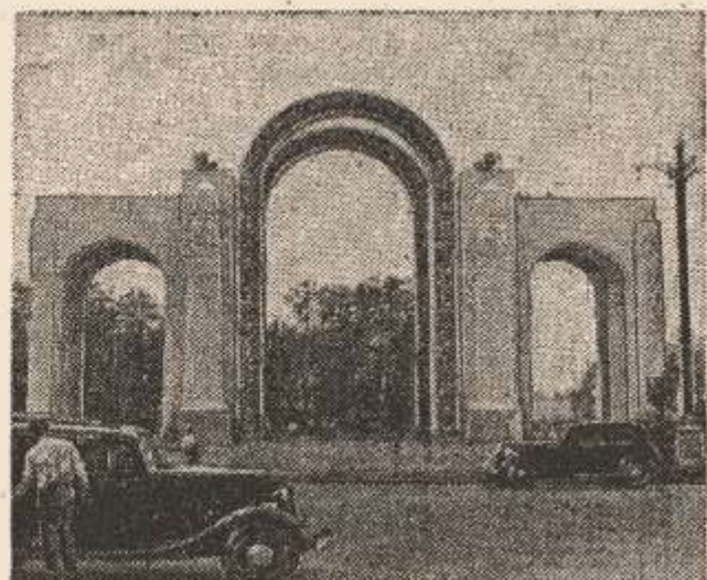
Сняты леса с главного входа на Всесоюзную сельскохозяйственную выставку.